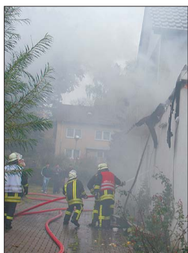
Immer wieder musste die Feuerwehr neue Brandherde löschen.

fund. Er sah kleinere Flammen oberhalb der Geschäftsräume und alarmierte über den Notruf die Feuerwehr. Bereits drei Minuten später war das erste Einsatzfahrzeug der Feuerwehr Espelkamp an der Einsatzstelle.