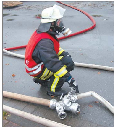
Die Feuerwehrmänner mussten unter Atemschutz arbeiten.