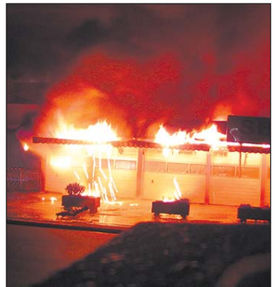
Das Feuer breitete sich rasend schnell aus.