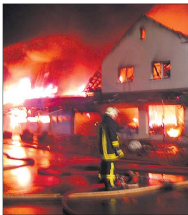
Bereits nach drei Minuten waren die ersten Feuerwehrleute vor Ort.

Gegen 3 Uhr 16 bemerkte nach Angaben der Feuerwehr der Ladeninhaber Brandgeruch in der Wohnung, die sich über den Lagerräumen seines Geschäfts be-