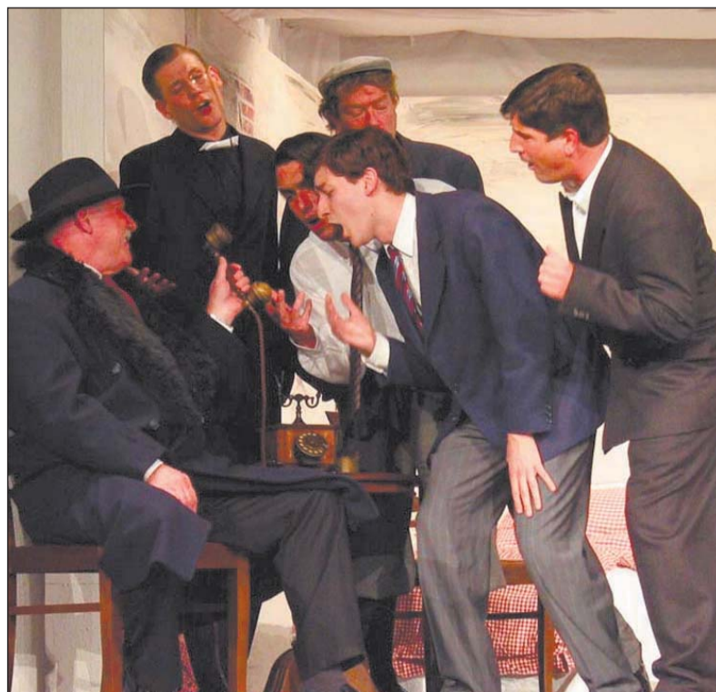
Das Ensemble Espelkamp landete mit der ersten Aufführung der »Comedian Harmonists« einen Volltreffer.