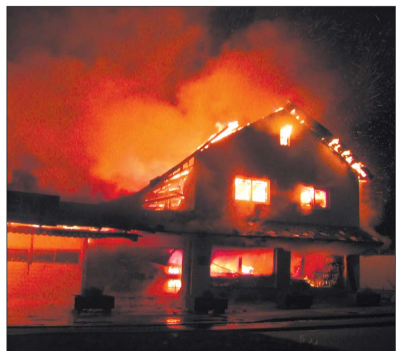
In nur wenigen Minuten standen auch die benachbarten Wohnungen des Lebensmitteladens lichterloh in Flammen.

dass nicht nur zahlreiche Feuerwehrmänner mit einer Atemschutzmaske arbeiten mussten sondern auch der Baggerführer.