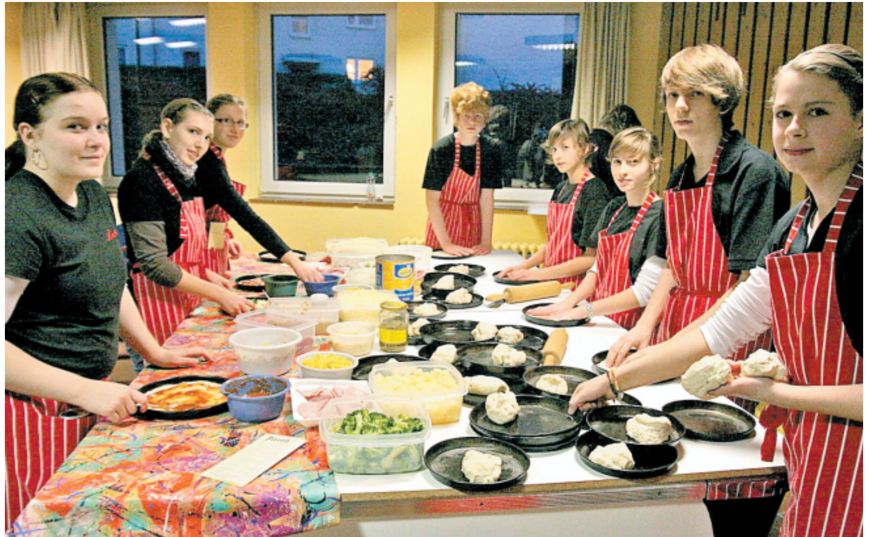
Viele fleißige Hände: In der Küche rollten die Mitarbeiter die Fladen aus und belegten sie mit verschiedenen Zutaten wie Tomaten, Zwiebeln, Paprika, Pilzen, Gemüse, Salami, Schinken und Käse.

STEINMANN: Die Aufführungen finden alle zwei Jahre statt. Da wage ich keine Prognose. Es sind auch Studenten dabei, da weiß man nicht, wohin es sie nach dem Examen ziehen wird.